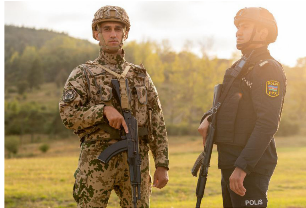
Azərbaycan uğurlu antiterror nümunəsi yaradıb

parametrlər üzrə Cənubi Qafqaz ölkələrini qabaqlaması başqa bir reallığı göz önünə gətirir. Eyni coğrafiyada yerləşən dövlətlər arasında təhlükəsizlik göstəricilərinə görə Azərbaycanın liderliyi açıq şəkildə görünür. Bu, qonşu ölkələrin təhlükəsizliyə cavabdeh olan qurumlarının peşəkarlığını, operativliyini və müasir çağırışlara nə dərəcədə uyğun fəaliyyət qabiliyyəti olduqlarını ortaya qoyur. Başqa sözlə desək, real təhlükəsizlik mühiti yarıdan Azərbaycanın polis və digər hüquq-mühafizə orqanlarının qonşularımızı öz peşəkarlıqları ilə açıq-aşkar qabaqladığı təsdiqlənir. Təbii ki, hər bir ölkədə təhlükəsizliyin qorunmasında polisin rolu xüsusi əhəmiyyət daşıyır. Çünki polisin işi hüquq pozuntularına reaksiya verməklə məhdudlaşmır, risklərin qarşısını əvvəlcədən alan güc kimi çıxış edir. İctimai asayişin təminatçısı, vətəndaş təhlükəsizliyini birbaşa təmin edən əsas qüvvə polistir. Polis və digər təhlükəsizlik qurumları ölkə daxilində mümkün risklərin qarşısını vaxtında almaqla, terror təhdidlərini ilkin mərhələdə zərərsizləşdirməklə sabitliyi Azərbaycan vətəndaşlarının gündəlik həyatının bir hissəsinə çevirməyə nail olublar.