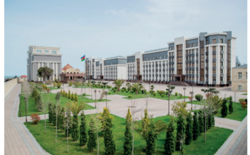
rəisləri ilə keçirilən görüşdə təhsil müəssisələri arasında qarşılıqlı

Akademiyanın rəhbərliyi, şöbə, bölmə və ixtisas kafedralarının