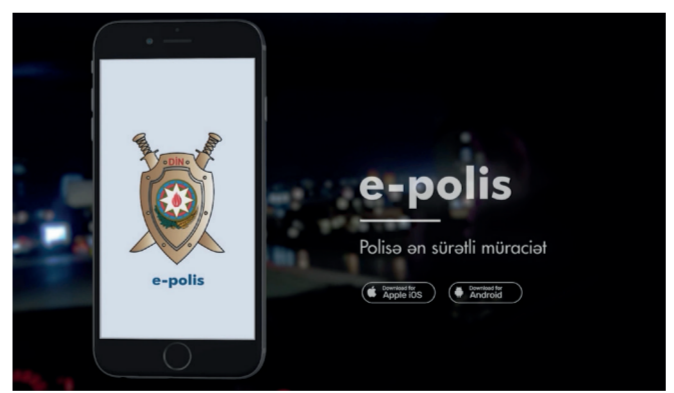
düyməsinə sıxaraq "cavabdeh barədə məlumat-

şəxslərdən qeyd edirsiniz. Ardınca müraciətin mövzusunun və hadisə yerini yazırsınız. Növbəti