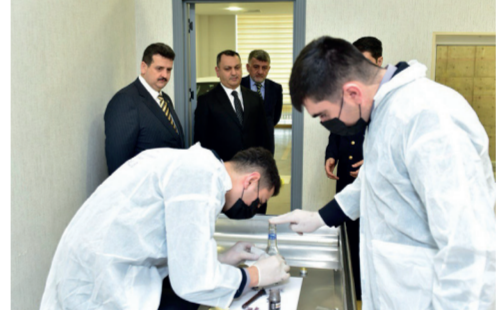
əlaqələrin önəmi vurğulanıb, polis təhsili sahəsində bundan sonra da

six əməkdaşlığın davam etdiriləcəyi bildirilib.