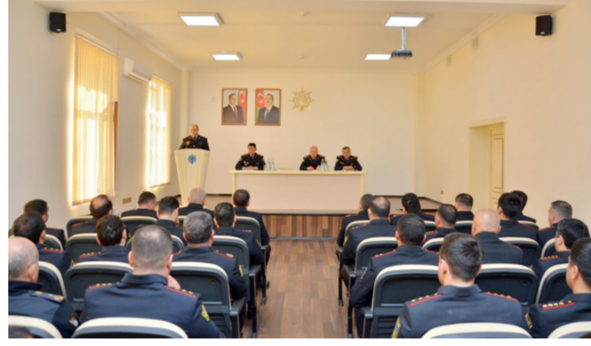
Şəxsi heyət arasında ideoloji və mənəvi-psixoloji hazırlığın yüksəldilməsi, gənc əməkdaşla-

Xidməti intizama və qanunçuluğa əməl etməyin vacibliyi aşılır