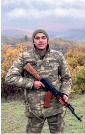
27 sentyabr 2020-ci ildə Azərbaycan xalqı Ali Baş Komandan Prezident

Tarixi faktlar qarşısında matı-qutu quruyanlar növbəti taktiki gedişlərini etməkdə aciz idilər. Regionda Azərbaycanın nüfuzunun yüksələn xətlə inkişafı, qüvvələr balansının xeyrimizə dəyişməsi vəziyyəti nəzarətimizdə saxlamağa imkan verirdi. Bütün bunları görməzlikdən gələn düşmən tarixi bir səhvə imza atdı. "Yeni müharibə, yeni torpaqlar" ideyası onun məhvini tezleşdirdi. Beləliklə,