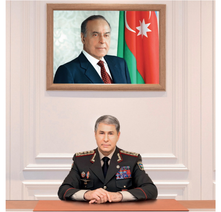
Vilayət Eyvazov Azərbaycan Respublikasının daxili işlər naziri general-polkovnik