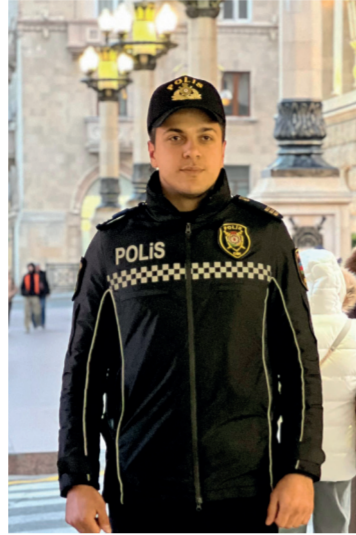
İlham Əliyevin hücum əmrinə arzusunu gerçəkləşdirdi. Torpaqlarımızın

işğaldan azad olunması cəmi 44 gün çəkdi. Şuşanın işğaldan azad olunması isə dünyanın hər tarixində az-az rastlanan hallardan idi.