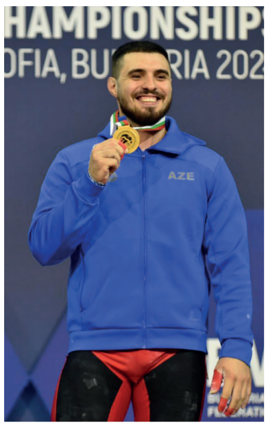
Bolqarıstanın paytaxtı Sofiyada ağırlıqaldırma