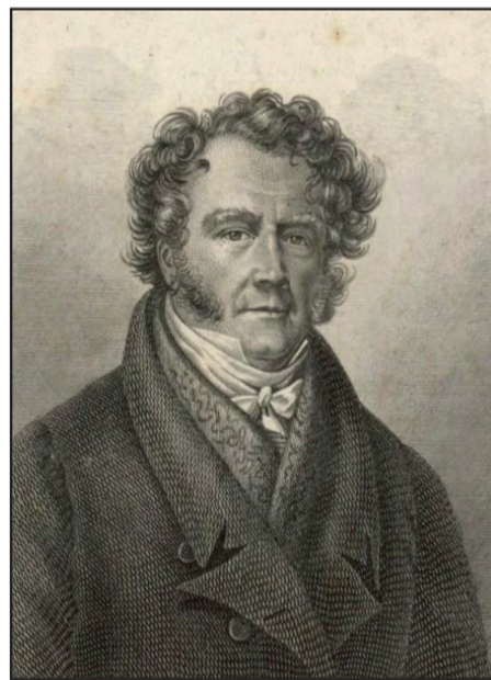
(Əvvəli ötən sayımızda)

Əməliyyat-axtarış işinin və kriminalistikanın əsasları