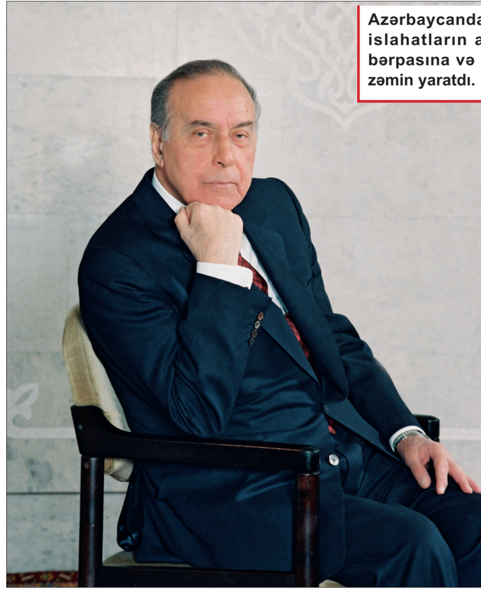
(Əvvəli ötən sayımızda)

Onun mübarizəsi xalqımızı azadlığına, dövlətimizi müstəqilliyinə qovuşdurdu