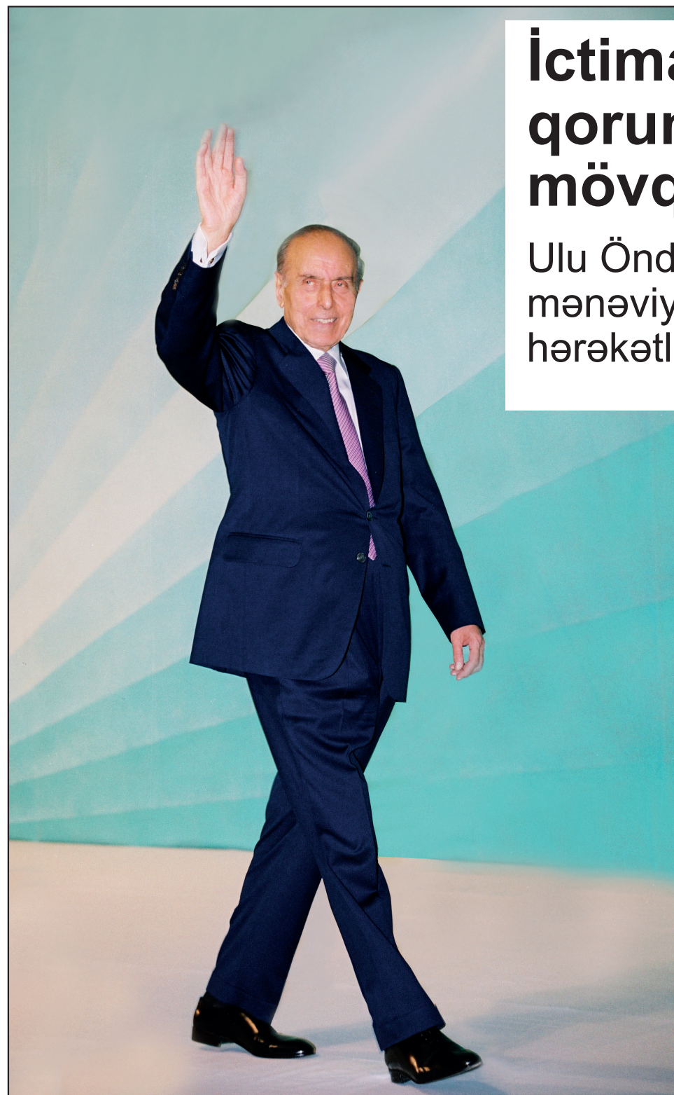
(Əvvəli 1-ci səhifədə)

Təhlükə potensialı obyektin təhlükəsiz istismarının təmin edilməsi sahəsində dövlət orqanlarının (qurumlarının) fəaliyyətinin əlaqələndirilməsi üzrə Koordinasiya Komissiyasının iclası keçirilib. Komissiyanın ilk iclasında Prezidentin 2022-ci il sentyabrın 24-də təhlükə potensialı obyektin təhlükəsiz istismarının təmin edilməsi sahəsində dövlət orqanlarının fəaliyyətinin əlaqələndirilməsi üzrə Koordinasiya Komissiyasının yaradılması haqqında Sərəncamının icrası ilə bağlı qarşıda duran vəzifələr və görülməli işlər müzakirə edilib.