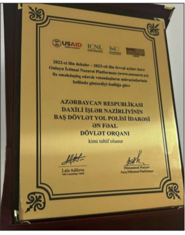
Beynəlxalq əməkdaşlıq çərçivəsində ölkəmizdə həyata keçirilən

E-Nəzarət Platformasının əsas məqsədi əhalinin üzleşdiyi problemləri çevik şəkildə aidiyyəti qurumlara çatdırmaq və onların həllinə nail olmaqdır.