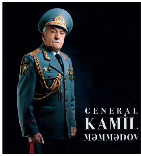
GENERAL KAMIL MƏMMƏDOV

Təəssüflər olsun ki, Xankəndində baş verənlərə seyrci qalmadığımızı, hətta qanuni şəkildə güc tətbiq etdiyimizi görəndə Azərbaycan əhalisinin Qarabağdan çıxarılması ilə məşğul olan xüsusi komitəyə başçılıq edən Sov.İKP MK nümayəndəsi Arkadi Volskinin tələbi ilə qərarımızı Ağdama köçürdülər.