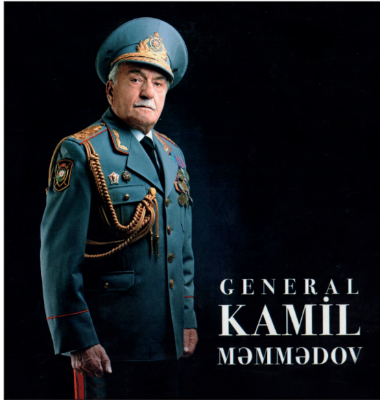
GENERAL KAMIL MƏMMƏDOV

1988-ci ildə ermənilər üçün ən vacib məsələlərdən biri Xankəndi şəhərindən və Kerkicahandan azərbaycanlıları təmizləmək idi. Buna səbəb isə Xankəndində yaşayan azərbaycanlıların tarix boyu erməniləri ifşa etməsi və beləliklə də onların Azərbaycanın tarixi torpaqlarına sahiblənmək istəyini, qurduqları planları alt-üst etmələri idi.