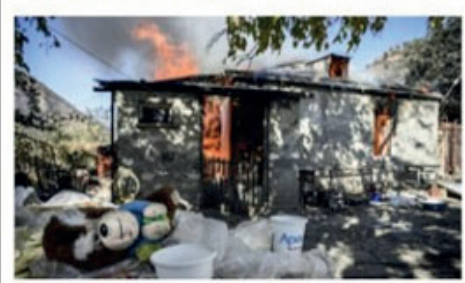
Ein Haus brennt in dem Dorf Charektar.

Berg-Karabach Armenier zünden vor Übergabe Aserbajdschan ihre Häuser an