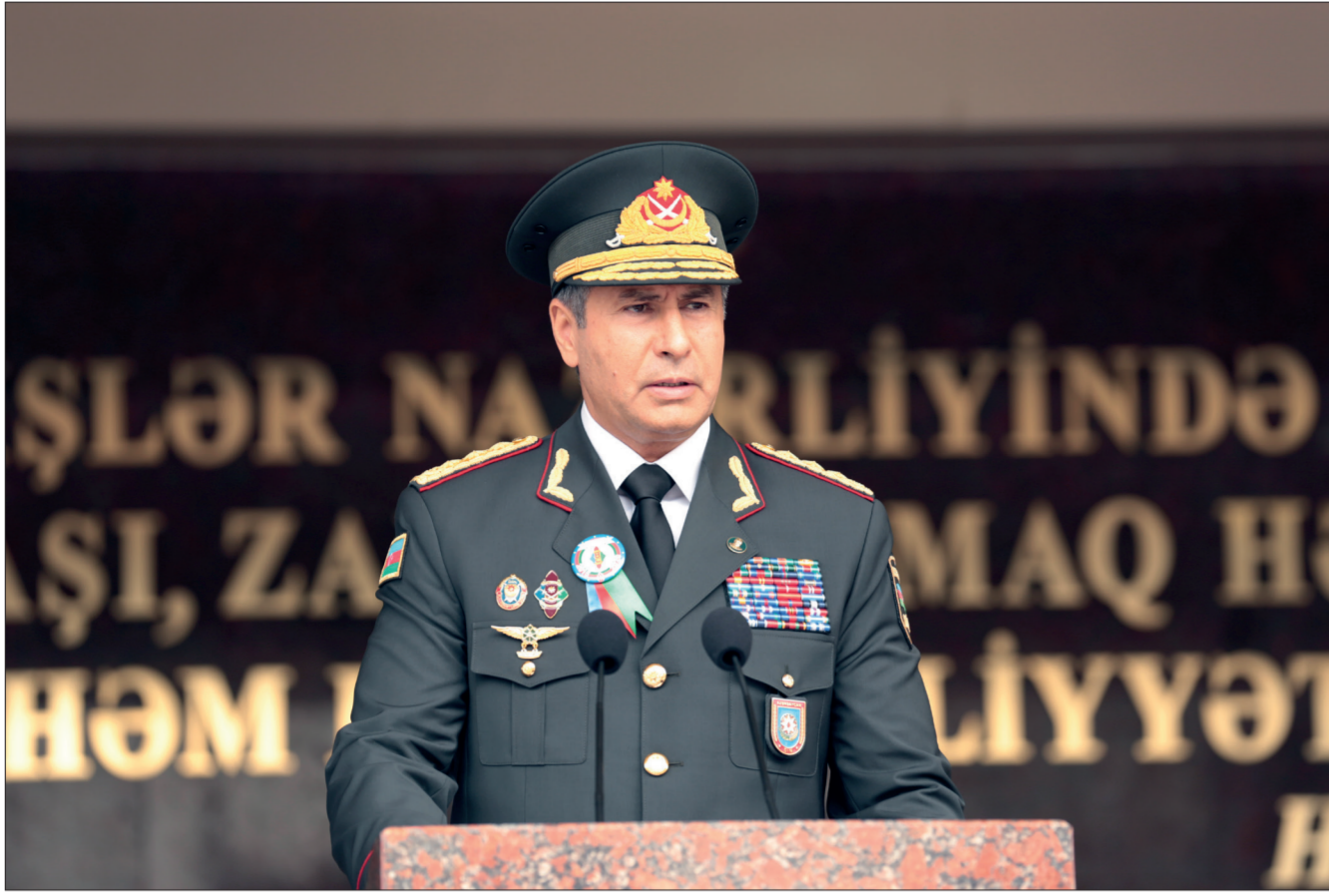
Əvvəli 1-ci səhifədə.