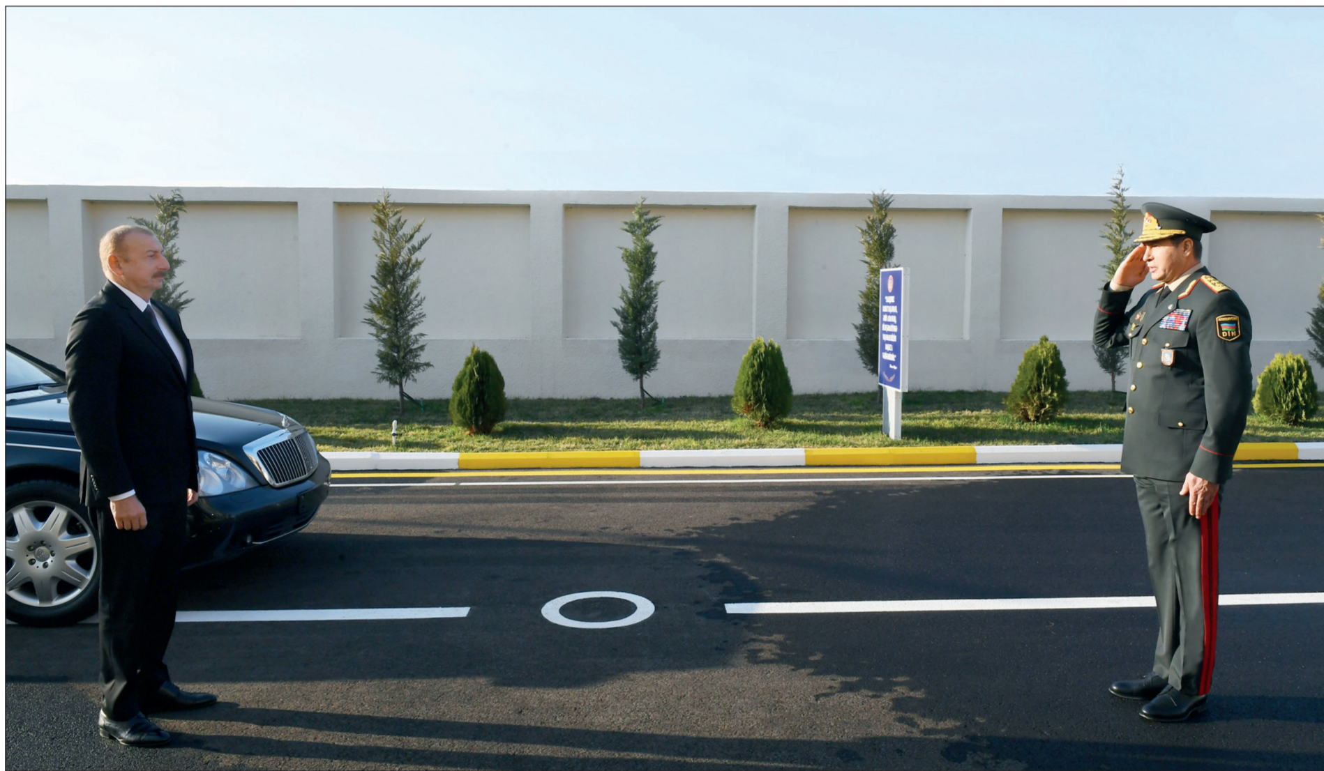
Daxili İşlər naziri, general-polkovnik Vilayət Eyvazov: "Dövlətin və xalqın mənafeyinə, Heydər Əliyev ideyalarına və Prezident İlham Əliyevin fəaliyyət kursuna sədaqətli, peşəkar xidmət Azərbaycan Polisinin əsas vəzifə borcudur"

sizliyini təsdiq edir. Nəticə etibarilə, Prezident İlham Əliyevin «Biz birlikdə güclüyük!» çağırışı ümummilli səfərbəredici qüvvəyə çevrilib və vətəndaşlarımız bu bələdan xilas yolunda öz Liderinin ətrafında daha sıx birləşib. Ölkə rəhbərinə son aylarda ünvanlanan on minlərlə vətəndaş məktubları da bu həqiqəti tam təsdiqləyir.