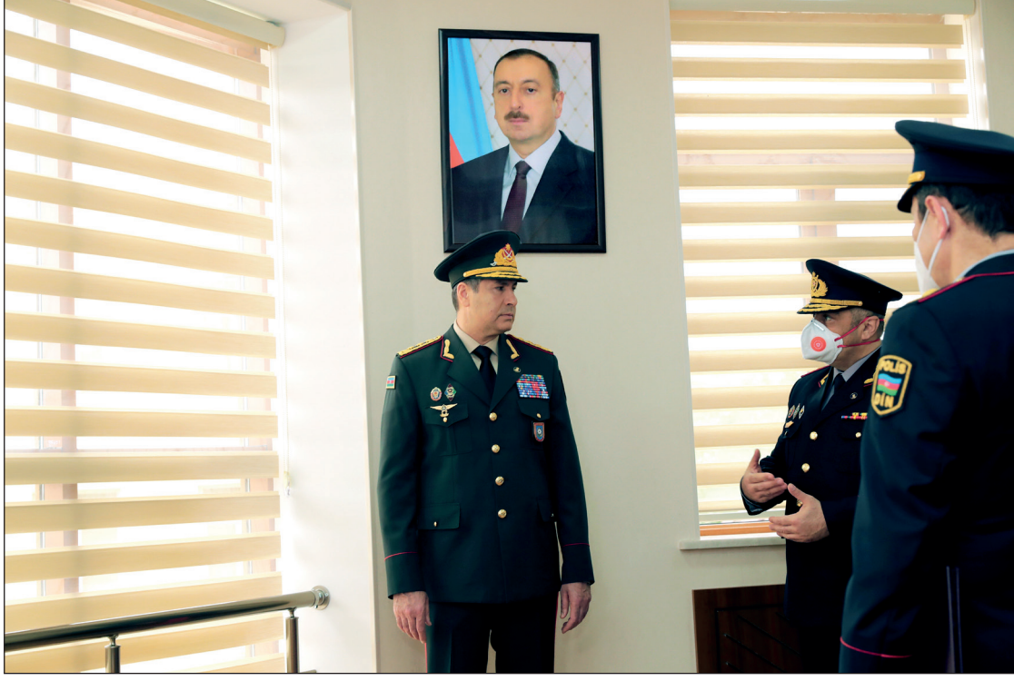
Əvvəli 1-ci səhifədə.

Qeyd olunub ki, ümumi sahəsi 1556 kvadratmetr olan inzibati bina bütün zəruri kommunikasiyalarla təchiz edilib. Xidməti otaqlar mebel və inventarlarla