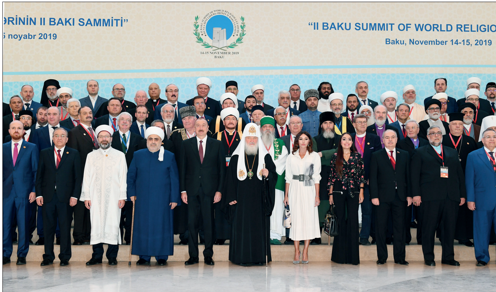
"DÜNYA DİNİ LİDERLƏRİNİN II BAKI SAMMİTİ"

Moskvanın və Bütün Rusiyanın Patriarxi Kirill,