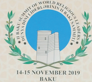
"II BAKU SUMMIT OF WORLD RELIGIOUS LEADERS"