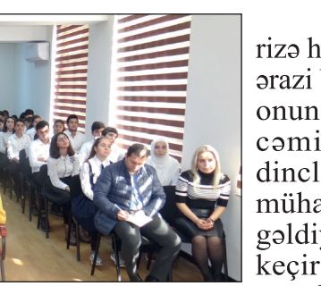
bu il 25 məzundan 17-nin ali məktəblərə daxil olduğunu, hətta onlar-

təkə paytaxtımızda deyil, eləcə də regionlarda çox böyük işlər görülmüşdür. Gənclərin asudə vaxtlarının səmərəli keçirilməsi üçün onlarla Olimpiya idman kompleksləri, gənclər evləri tikilib və istifadəyə verilib.