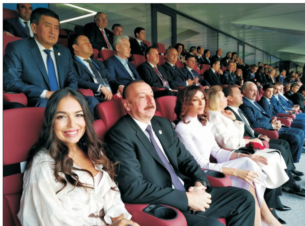
Ronaldo da açılış mərasiminə qatılıb. Dünya çempionatına ev sahibliyi edən Rusiya Federasiyasının Prezidenti Vladimir Putin mərasimdə çıxış edib.

Rusiya dövlətinin başçısı bütün qonaqları Moskvanın əfsanəvi "Lujniki" stadionunda salamlayaraq, dünyanın mehriban futbol ailəsinə çempionatın açılış münasibətilə təbrik edib. Bu möhtəşəm idman hadisəsinin ilk dəfədir ki, Rusiyada keçirildiyini deyən Vladimir Putin ölkəsində bu idman növünə xüsusi sevginin bəsləndiyini də əlavə edib. O, bu idman bayramını Rusiyada qəbul etmək üçün dünya çempionatına məsuliyyətlə hazırlaşdıqlarını bildirib. "Harada yaşamağımızdan, hansı ənənələrə riayət etdiyimizdən asılı olmayaraq, bizim hamımızı bu parlaq idman növü - futbola sevgi birləşdirir. Futbolun gücünün əsasını humanizm təşkil edir. Çünki bu, birlikdir", - deyən Rusiya Prezidenti bu birliyi gələcək nəsillər üçün qoruyub-saxlamağın vacibliyini vurğulayıb.