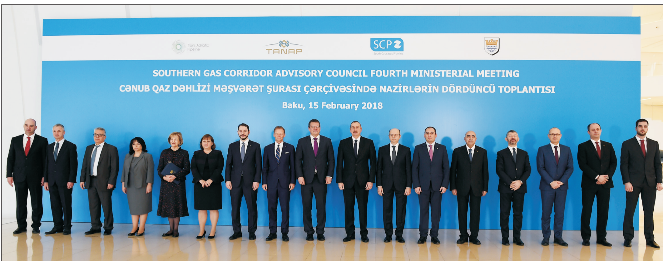
SOUTHERN GAS CORRIDOR ADVISORY COUNCIL FOURTH MINISTERIAL MEETING CƏNUB QAZ DƏHLİZİ MƏŞVƏRƏT ŞURASI ÇƏRÇİVƏSİNDƏ NAZİRLƏRİN DÖRDÜNCÜ TOPLANTISI Baku, 15 February 2018